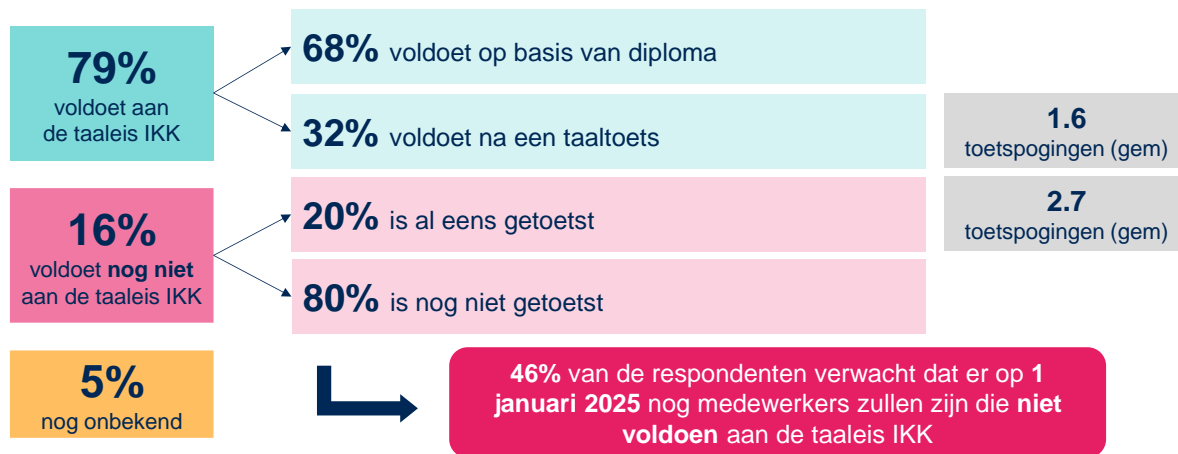
Figuur 2. Cijfermatige stand van zaken kinderopvangorganisaties op basis van de enquête. Peildatum: 29 september 2023. We hebben geen beeld van de spreiding van het aantal toetspogingen per persoon, omdat we deze variabele op organisatieniveau hebben uitgevraagd

Desalniettemin is er een niet-verwaarloosbare groep pedagogisch medewerkers die op dit moment nog niet voldoet aan de taaleis IKK. Op basis van de enquêteresultaten gaat dit om 16% van de pedagogisch medewerkers in Nederland. Van deze groep is 20% al hard bezig met de taaleis IKK (met gemiddeld 2,7 toetspogingen). De andere 80% is nog niet eerder getoetst op de taaleis IKK.