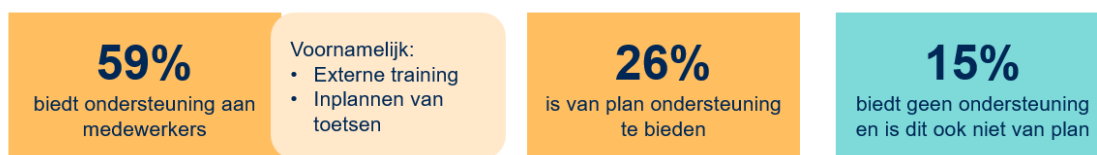
Figuur 3. De ondersteuning vanuit kinderopvangorganisaties richting pedagogisch medewerkers

de kinderopvangorganisaties tot op heden (nog) geen ondersteuning aan medewerkers. Een deel daarvan is dit wel van plan (zie figuur 3).