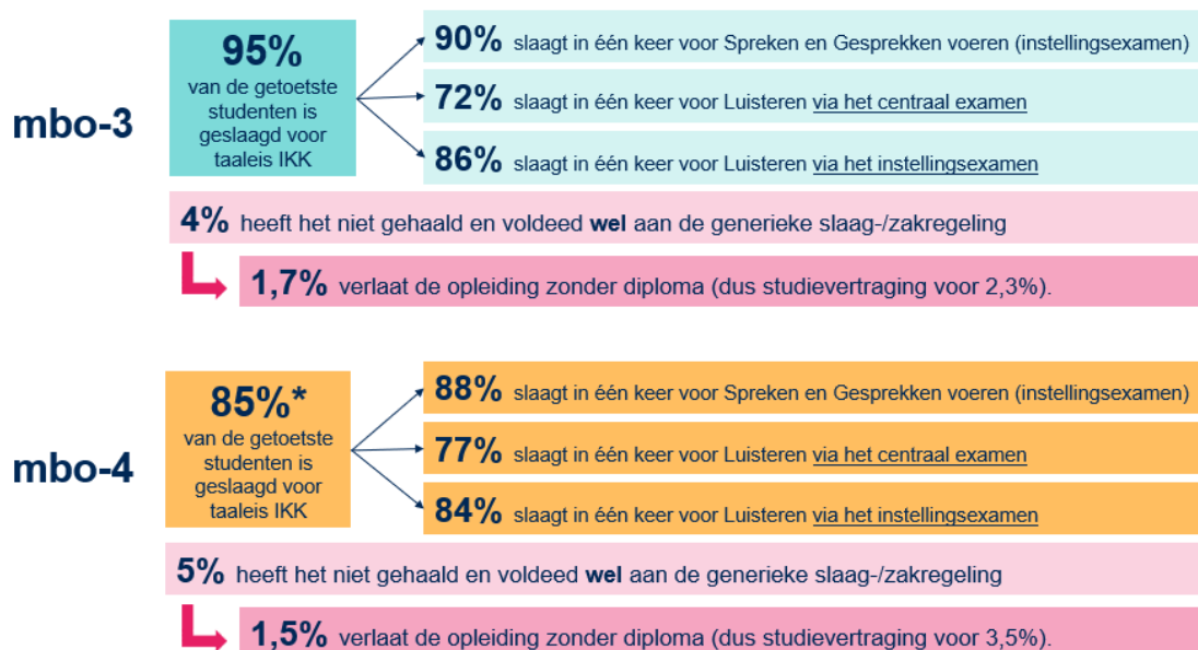
Figuur 4. Cijfermatige stand van zaken bij roc's op basis van de enquête. Cijfers hebben betrekking op het studiejaar 2022/2023 (* Zonder uitbijter: 92%)

Voor 4 - 5% van de studenten vormt de taaleis IKK het laatste obstakel in het afronden van hun opleiding. Zij voldeden in het studiejaar 2022/2023 wel aan de generieke diploma-eisen, maar niet aan de taaleis IKK. Als we dit extrapoleren naar het landelijke aantal getoetste studenten per jaar, dan halen circa 200 à 350 studenten per jaar de taaleis IKK niet, terwijl ze wel voldoen aan de generieke slaag-/zakregeling . Voor veel van hen resulteert dit in studievertraging. De groep die de opleiding verlaat zonder diploma valt hier ook onder (zie paragraaf 3.2.3).