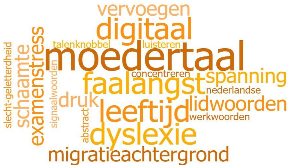
Figuur 6. Wordwolk op basis van de belemmerende persoonlijke kenmerken die kinderopvangorganisaties benoemen in de enquête. Hoe groter het woord, hoe vaker dit kenmerk is benoemd

Niet geheel onverwacht is ook de taalachtergrond van de pedagogisch medewerker van invloed op hun taaleis IKK-traject. Kinderopvangorganisaties zien dat medewerkers voor wie Nederlands niet de moedertaal is vaker moeite hebben met de toetsen; veelal hebben zij een migratieachtergrond. Voor hen vormen de deelvaardigheden Spreken en Gesprekken voeren ook vaker een struikelblok, terwijl Nederlandstalige pedagogisch medewerkers hier zelden moeite ervaren. Dat deze groep vaak struikelt over de taaleis IKK is volgens sommige kinderopvangorganisaties een “spijtige realiteit”, omdat velen van hen uitstekende pedagogisch medewerkers zijn. Ook belemmert de taaleis IKK de aanwas van potentieel nieuw personeel, zoals Oekraïense pedagogisch medewerkers of statushouders die een inburgeringsexamen op niveau A2 of B1 (onder 3F) hebben afgerond. De meerwaarde van pedagogisch medewerkers met een rijke taalachtergrond wordt eveneens benadrukt, bijvoorbeeld als het gaat om de communicatie met ouders met een niet-Nederlandse taalachtergrond. Wat in ieder geval duidelijk is, is dat deze groep pedagogisch medewerkers meer aandacht en begeleiding nodig heeft om te voldoen aan de taaleis IKK.