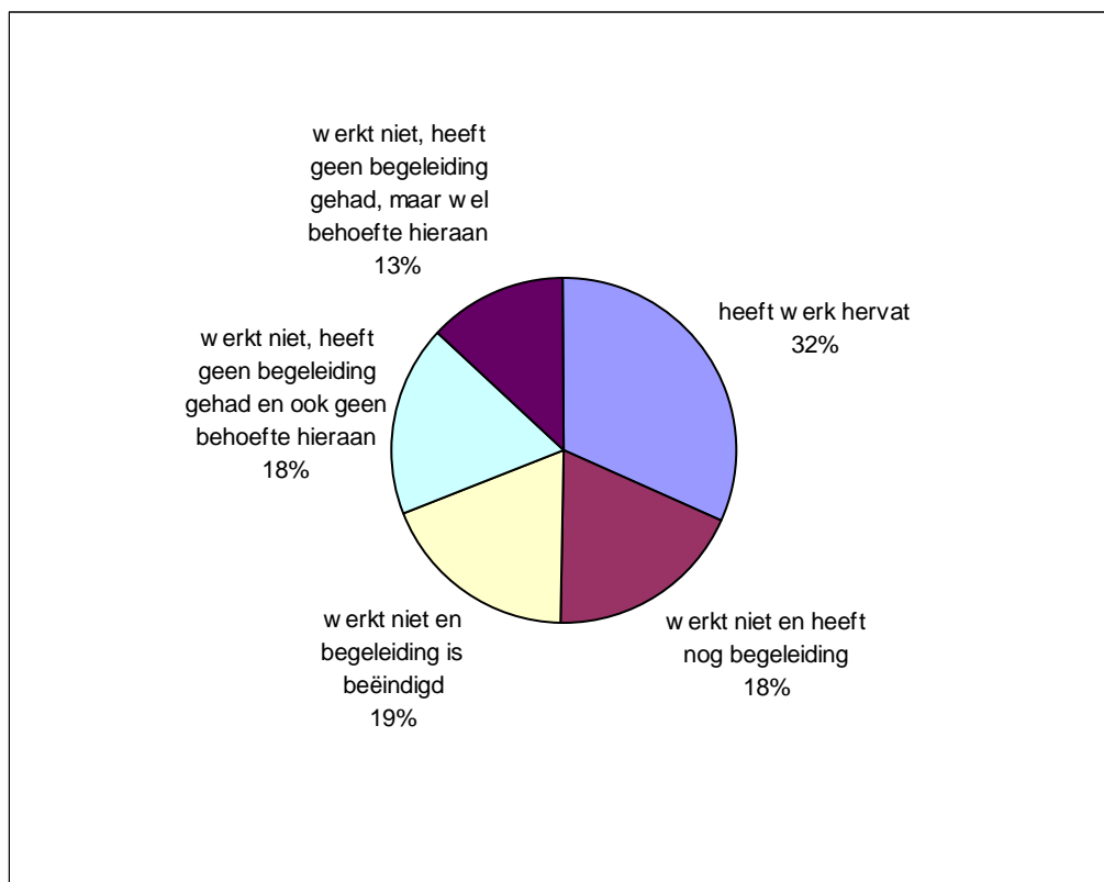
Figuur 6.3 Overzicht werkhervatting, begeleiding en begeleidingsbehoefte (als percentage van de groep die bij de herbeoordeling geen werk heeft)