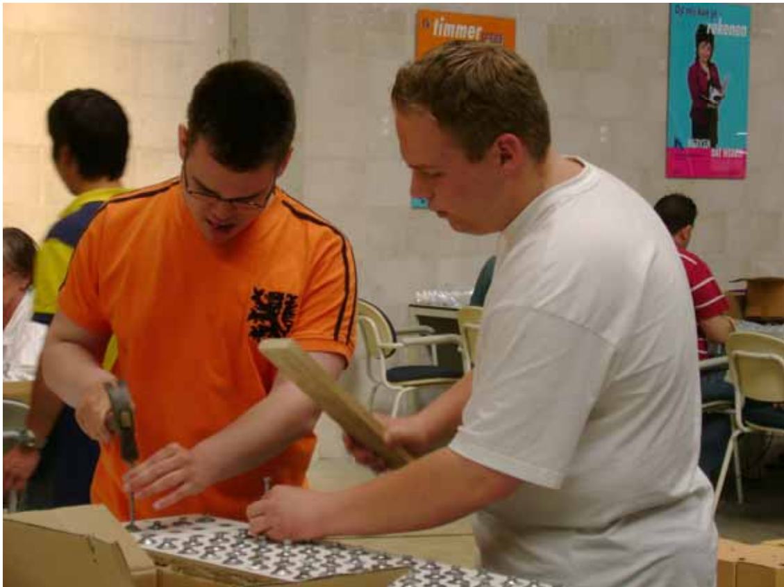
Bijstandsgerechtigden aan het werk in een Arbeidstrainingscentrum.

Steeds meer gemeenten zijn de pilotfase voorbij en implementeren Work First in hun reguliere beleid. In eerste instantie is Work First ingezet voor een beperkte groep, met name jongeren of nieuwe instroom. Vaak wordt Work First na de pilotfase ook ingezet voor (een deel van) de overige klanten.