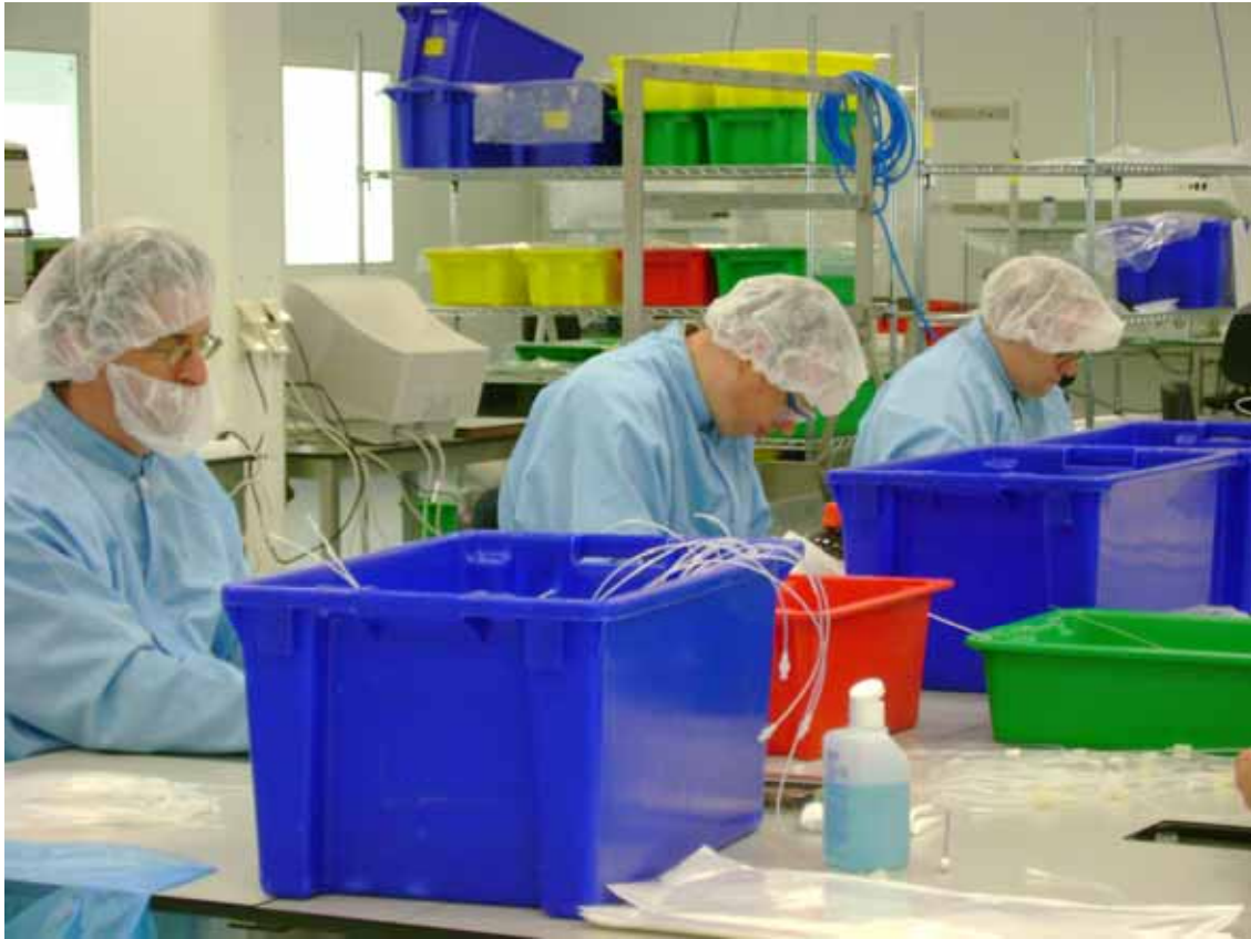
Bijstandsgerechtigden aan het werk via het Work First concept.