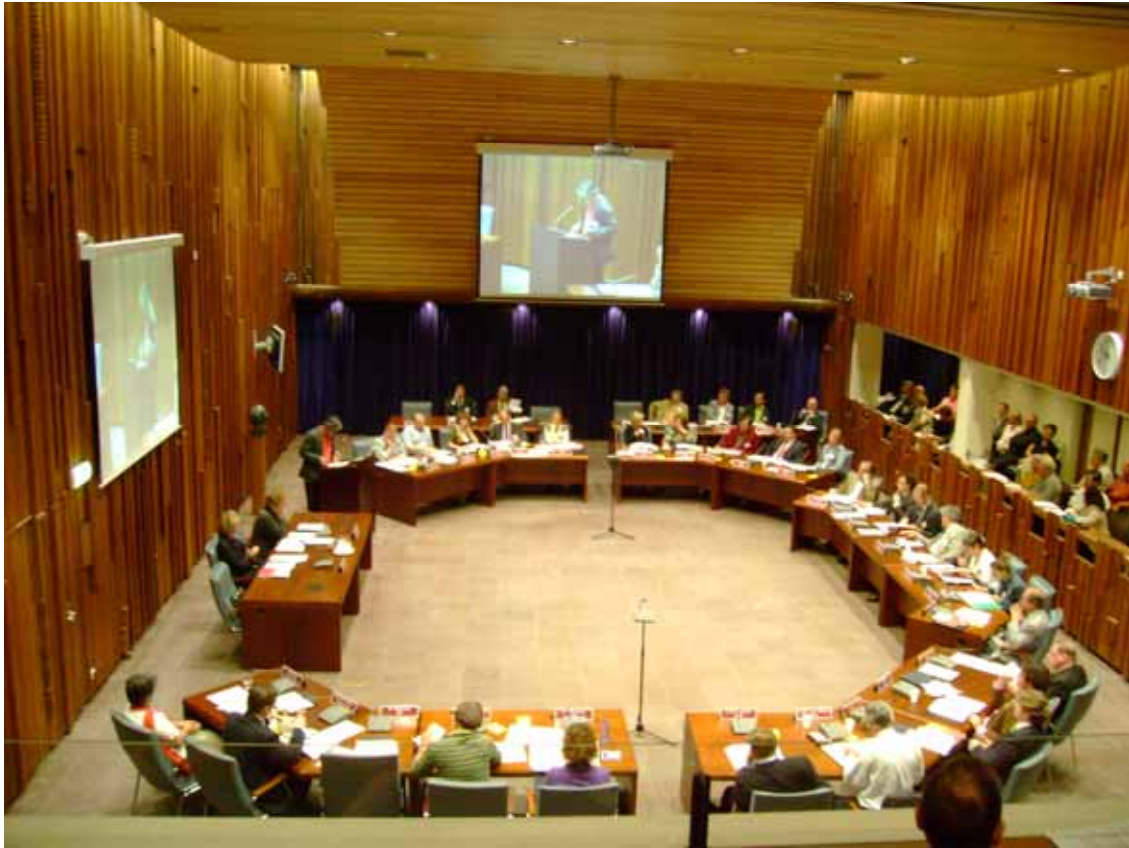
Bespreking van de WWB in een raadsvergadering.

In andere gemeenten lijkt de aandacht voor de kaderstellende rol van de raad juist te verslappen. Dit zijn gemeenten waarbij de raad bij invoering van de WWB zeer actief was betrokken. Deze gemeenten benoemen twee oorzaken voor de verminderde aandacht. Ten eerste het feit dat veel raadsleden pas kort zitting hebben in de raad en daardoor onvoldoende op de hoogte zijn van de WWB 1 . Dit houdt in dat de nieuwe raad een kennisachterstand heeft ten opzichte van de vorige raad. Daarnaast speelt bij sommige gemeenten dat de informatieverstrekking na invoering van de WWB is verminderd. De kaders zijn immers grotendeels reeds gesteld, de ambtelijke organisatie focust zich nu met name op de uitvoering. De kaderstellende rol lijkt hierbij minder belangrijk geworden.